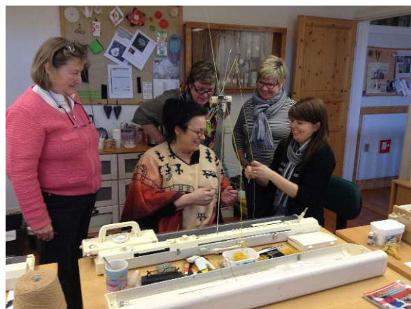
Kurs i maskinstickning

Balansboken uppgjord av Ålands Företagsbyrå Ab, auktoriserad redovisningsbyrå Nygatan 9, 22100 Mariehamn, tel 018-29044