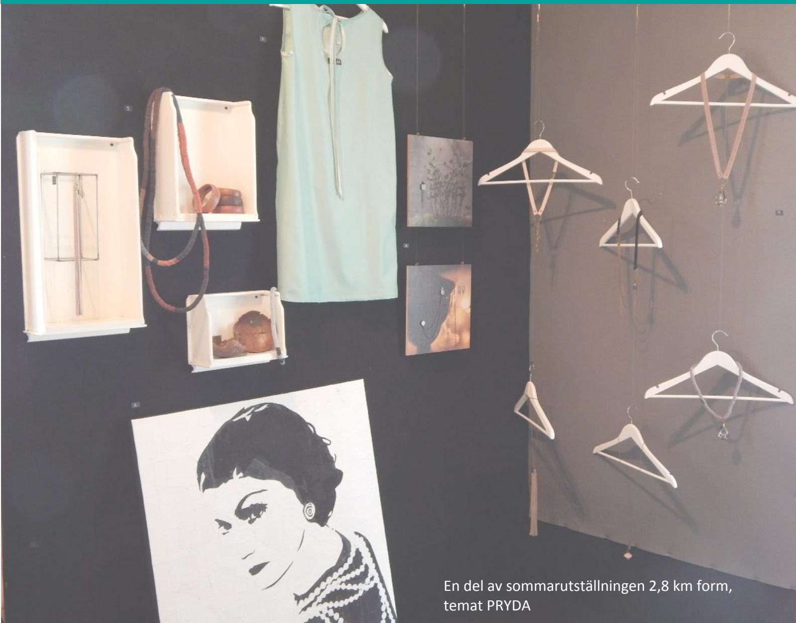
En del av sommarutställningen 2,8 km form, temat PRYDA