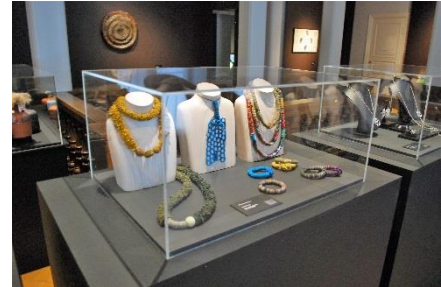
Margareta Svenssons smycken i Emil Aaltonens museum i Tammerfors.

Under hösten 2018 bjöd Modus in föreningen att visa en del av Kalevaland tillsammans med dem i Emil Aaltonens museum i centrala Tammerfors. Utställningen visas till och med 29. januari 2019 och efter det får vi veta mer om besöksiffror och vilken uppmärksamhet utställningen har väckt. 10 åländska hantverkare fick ställa ut efter utställningsarkitektens urval.