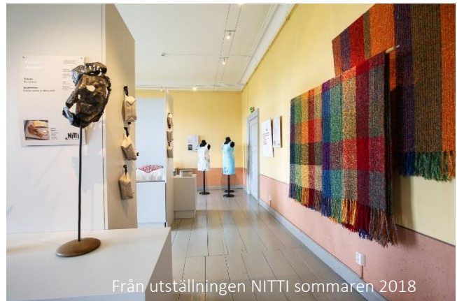
Från utställningen NITTI sommaren 2018

Ålands Slöjd & Konsthantverk bjuder in systerorganisationer från andra öar i Östersjön att delta och skicka in deras konsthantverkarens bästa produkter.