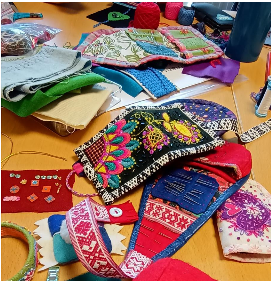
Grannlåtsbroderikurs på Ullhelgen